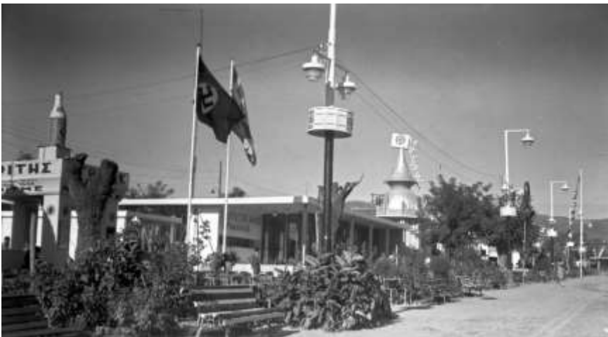
1940 Η επίσημη κρατική συμμετοχή της Γερμανίας στη 15η Διεθνή Έκθεση Θεσσαλονίκης (22 Σεπτεμβρίου-22 Οκτωβρίου 1940)

Η τελευταία προπολεμική Διεθνής Έκθεση Θεσσαλονίκης πραγματοποιήθηκε στις νέες εγκαταστάσεις της, οι οποίες όμως επρόκειτο να χρησιμοποιηθούν μόνο για ένα έτος, καθώς κατά τη διάρκεια της γερμανικής κατοχής που επακολούθησε υπέστησαν βαρύτατες καταστροφές.