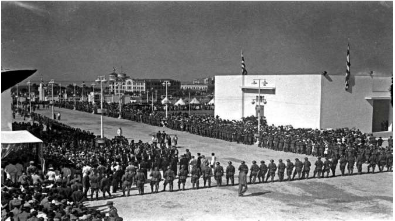
1940 Τα πρώτα εγκαίνια της ΔΕΘ στον νέο χώρο