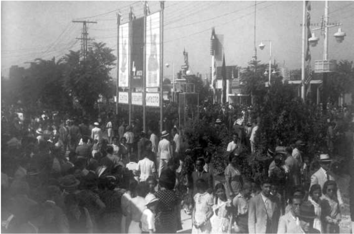
1936 Στιγμιότυπο από τους ανοιχτούς χώρους τής 13ης ΔΕΘ. Διακρίνονται πανό τού καθεστώτος της 4ης Αυγούστου